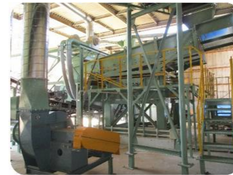
SWS型木材チップ複合選別機