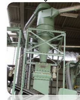
木材チップ返送サイクロン